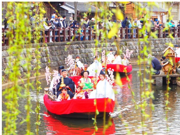
佐原のひなめぐり