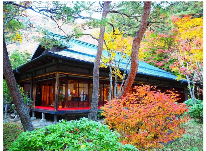
那須塩原温泉郷・天皇の間記念公園