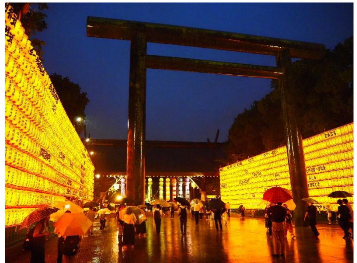
靖国神社・みたままつり