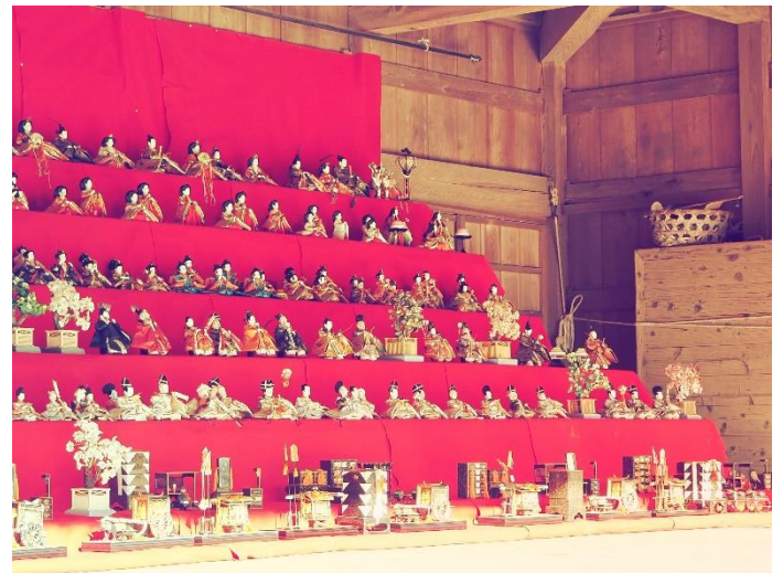
雛飾り（千葉県・房総のむら）